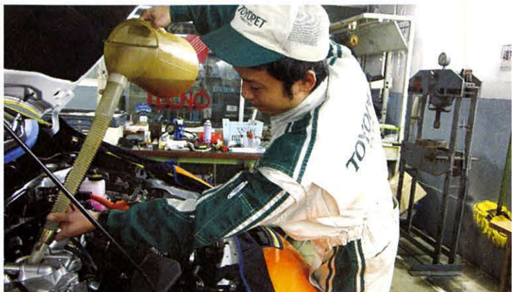
最高クラスのオイルや部品を使用 スマイルパスポートで使用するエンジンオイルは、米国API規格でトップランクのオイル(ガソリン車)です。

スマイルパスポートシリーズでは、入庫時期のご案内、高品質整備および整備結果に基づいたメンテナンスアドバイスの実施など、お客様に安心・お得・便利なアフターケアをご提供いたします。