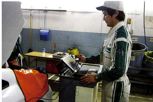
ハイブリッドシステムを診断機(GTS)を使って異常がないか確認します。