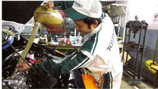
最高クラスのオイルや部品を使用 スマイルパスポートで使用するエンジンオイルは、米国API規格でトップランクのオイル（ガソリン車）です。

スマイルパスポートシリーズでは、入庫時期のご案内、高品質整備および整備結果に基づいたメンテナンスアドバイスの実施など、お客様に安心・お得・便利なアフターケアをご提供いたします。