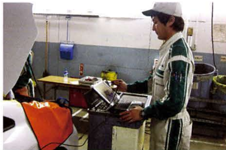
ハイブリッドシステムを診断機（GTS）を使って異常がないか確認します。